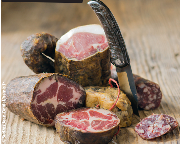
Coppa, figatellu, lonzu et saucisson

À l'hôtel, pensez à les demander au moment de la réservation ou, si vous n'avez pas réservé, à l'arrivée . Ils ne sont valables que pour les réservations en direct et ne sont pas cumulables avec d'autres offres promotionnelles (notamment sur Internet). Au restaurant, parlez-en au moment de la commande et surtout avant que l'addition soit établie. Poser votre Routard sur la table ne suffit pas : le personnel de salle n'est pas toujours au courant et une fois le ticket de caisse imprimé, il est souvent difficile de modifier le total. En cas de doute, montrez la notice relative à l'établissement dans le Routard de l'année et, bien sûr, ne manquez pas de nous faire part de toute difficulté rencontrée.