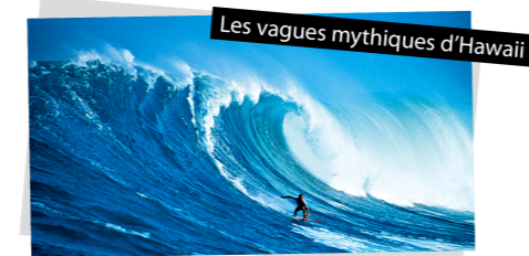
Les vagues mythiques d'Hawaii