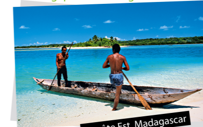
La côte Est, Madagascar