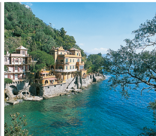
Paysage de carte postale à Paraggi, près de Portofino