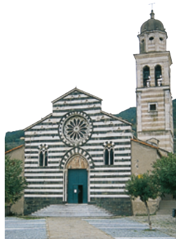
L'église gothique de Sant'Andrea, à Levanto