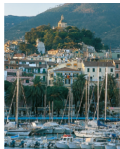
Le port de San Remo, l'une des stations les plus populaires de la côte