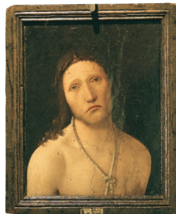
Ecce Homo d'Antonello da Messina, palazzo Spinola, Gênes