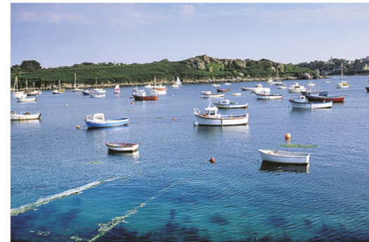
Portsall, Côte des Abers (p. 132-133)