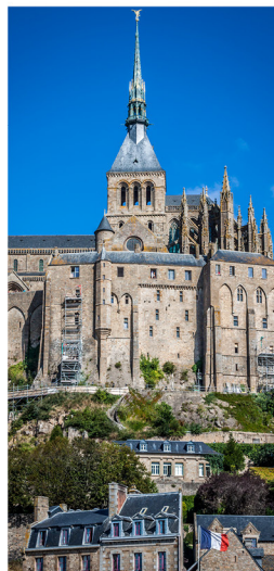
L'abbaye du Mont-Saint-Michel perchée sur son rocher au milieu de la baie