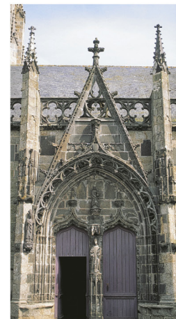
Basilique Notre-Dame, Folgoët