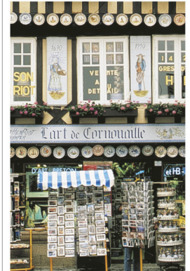
Boutique de la faïencerie Henriot, Quimper