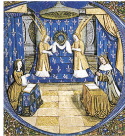
Peinture de Louis XII et Anne de Bretagne, musée Thomas-Dobrée