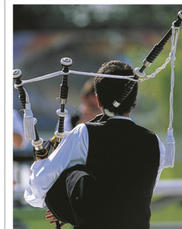
Joueur de cornemuse au Festival interceltique de Lorient