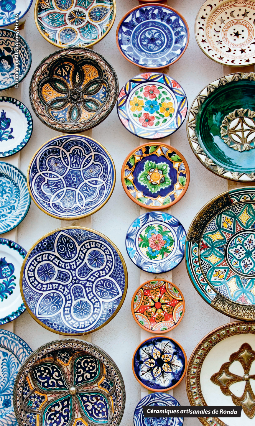
Céramiques artisanales de Ronda