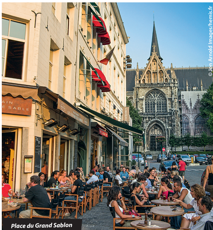
Place du Grand Sablon

À l'hôtel, pensez à les demander au moment de la réservation ou, si vous n'avez pas réservé, à l'arrivée . Ils ne sont valables que pour les réservations en direct et ne sont pas cumulables avec d'autres offres promotionnelles (notamment sur Internet). Au restaurant, parlez-en au moment de la commande et surtout avant que l'addition soit établie. Poser votre Routard sur la table ne suffit pas : le personnel de salle n'est pas toujours au courant et une fois le ticket de caisse imprimé, il est souvent difficile de modifier le total. En cas de doute, montrez la notice relative à l'établissement dans le Routard de l'année et, bien sûr, ne manquez pas de nous faire part de toute difficulté rencontrée.