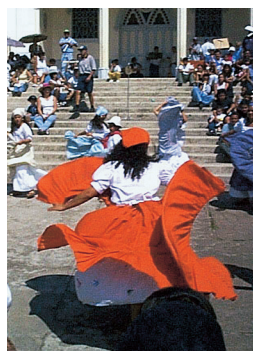
Spectacle de danse près de Cartago