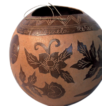
Gourde traditionnelle bibrri peinte et sculptée