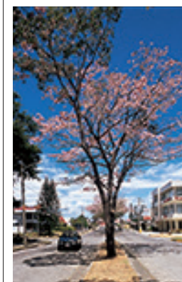
Rue dans la jolie localité de San José