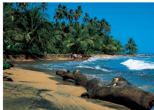
Playa Chiquita sur la côte caraïbe