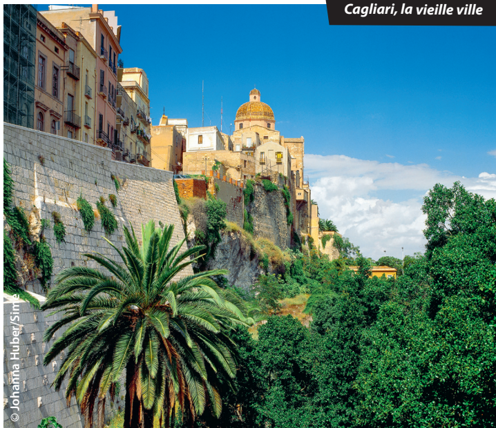
Cagliari, la vieille ville

☎ 112 : c'est le numéro d'urgence commun à la France et à tous les pays de l'UE, à composer en cas d'accident, agression ou détresse. Il permet de se faire localiser et aider en français, tout en améliorant les délais d'intervention des services de secours.