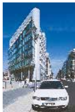
Immeuble moderne près de Checkpoint Charlie (p. 145)