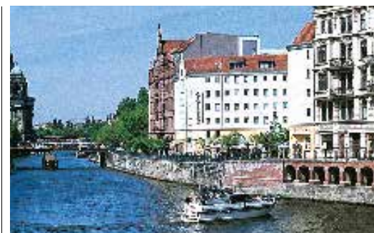
Au bord de la Spree dans le quartier Nikolaiviertel (p. 90-91)