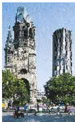
L'église du Souvenir bombardée en 1943 (p. 156-157)