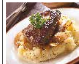
Kasseler Nacken, échine de porc salée et séchée (p. 229)