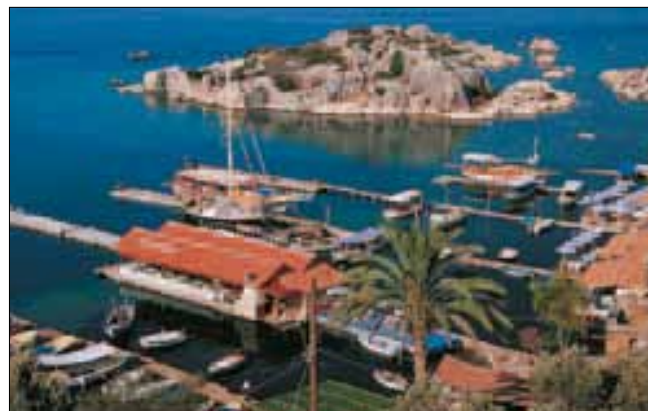
Le village d'Uçağız

Achevé d'imprimer en janvier 2012 Dépôt légal : janvier 2012 ISBN : 978-2-01-245373-9 ISSN : 1246 - 8134 Collection 32 – Édition 01 N° de codification : 24-5373-6