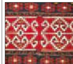
Tissages turcs à motifs géométriques

SÉJOURS À THÈME ET ACTIVITÉS DE PLEIN AIR 384