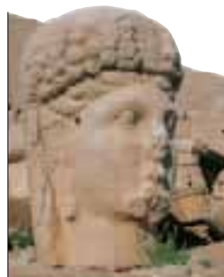
Tête en pierre sur le mont Nemrut