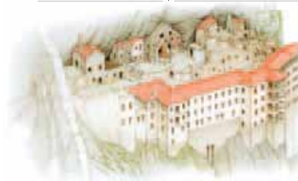
Monastère de Sumela (p. 272)