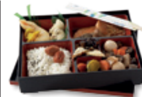
Un makomouchi bento , panier repas classique