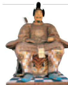
Figure de la cour, porte Yomeimon, sanctuaire Toshogu, Nikko