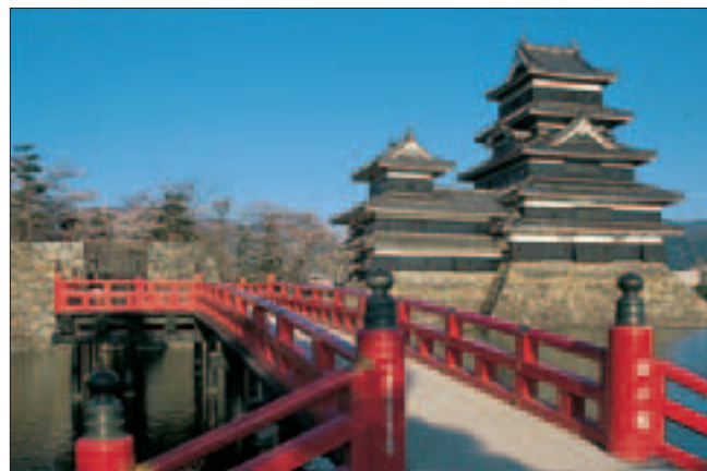
Le Matsumoto Castle dans les Alpes japonaises

Aussi soigneusement qu'il ait été établi, ce guide n'est pas à l'abri des changements de dernière heure. Faites-nous part de vos remarques par mail à l'adresse suivante : voir@hachette-livre.fr