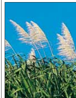
Fleches de canne