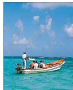
Balade en mer

LES ÎLES SAINTE-LUCIE, SAINT-VINCENT ET LES GRENADINES 186