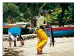
Retour de pêche à Tartane