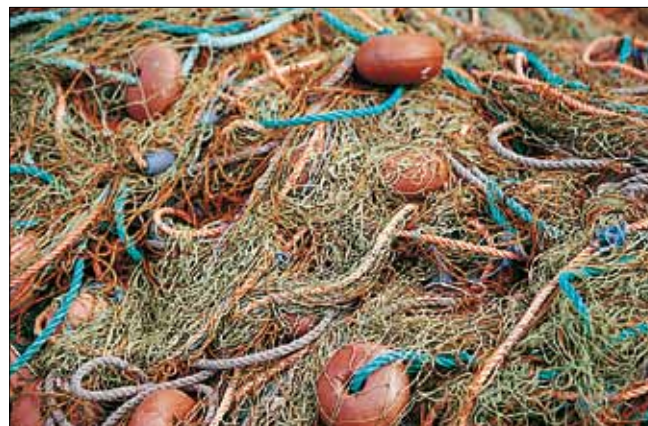
Filets de pêche

Dépôt légal : septembre 2010 ISBN : 978-2-01-244577-2 ISSN : 1246 - 8134 Collection 32 – Édition 01 N° DE CODIFICATION : 24-4577-3