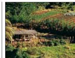
Champs au Morne-Vert