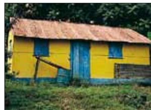
Case au Robert