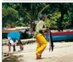
Retour de pêche à Tartane