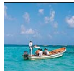
Balade en mer

LES ÎLES SAINTE-LUCIE, SAINT-VINCENT ET LES GRENADINES 174