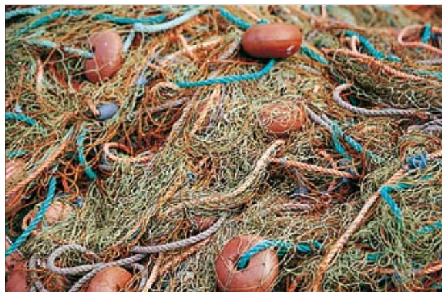
Filets de pêche

DÉPÔT LÉGAL : janvier 2009 ISBN : 978-2-01-244551-2 ISSN : 1246-8134 Collection 32 - Édition 01 N° DE CODIFICATION : 24-4551-8