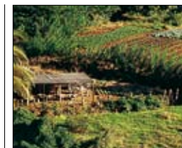
Champs au Morne-Vert