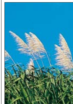
Fèles de canne