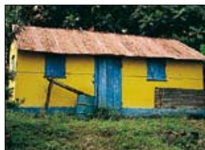
Case au Robert