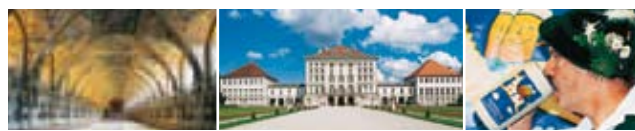
Gauche Antiquarium, Residenz Centre Schloss Nymphenburg Droite Oktoberfest

Aussi soigneusement qu'il ait été établi, ce guide n'est pas à l'abri des changements de dernière heure. Faites-nous part de vos remarques par e-mail à l'adresse suivante : voir@hachette-livre.fr .