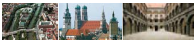
Gauche Deutsches Museum Centre Frauenkirche Droite Alte Münze