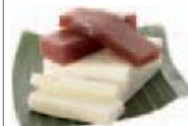
Guayaba et fromage