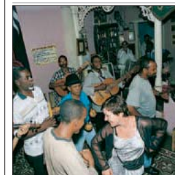
Danse à la Casa de la Tradición à Santiago de Cuba