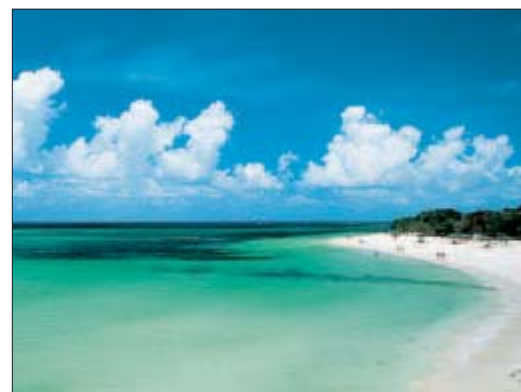
La plage de Guardalavaca, l'une des plus renommées de Cuba