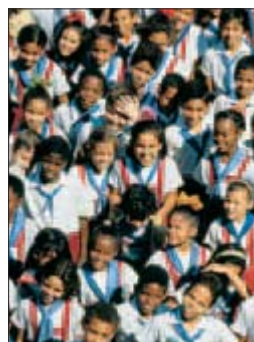
Élèves à la sortie d'une école de Santiago de Cuba