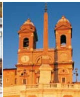
Gauche Intérieur du Panthéon Droite Église de Trinità dei Monti