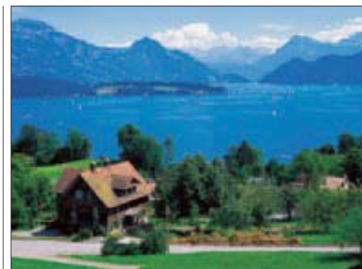
Le lac des Quatre-Cantons, cœur géographique et historique de la Suisse