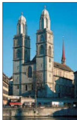
Les tours imposantes du Grossmünster, Zürich