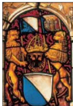
Blason de Zürich, Schweizerisches Landesmuseum, Zürich