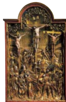
Panneau du retable de 1513, église des Cordeliers, Fribourg