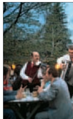
Restaurant à Grinzing (p. 186-187)

LE MUSEUMSQUARTIER ET L'HÔTEL DE VILLE 112