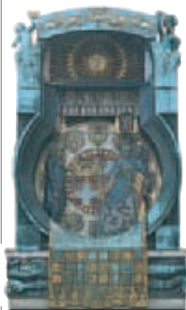
L'Ankeruhr, horloge Art nouveau du Hoher Markt (p. 84)