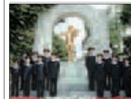
Petits Chanteurs de Vienne (p. 39)

PLAN DES TRANSPORTS PUBLICS couverture intérieure en dernière page