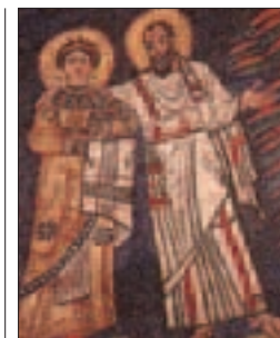
Mosaïque à Sainte-Praxède