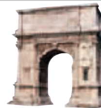
Arc de Titus