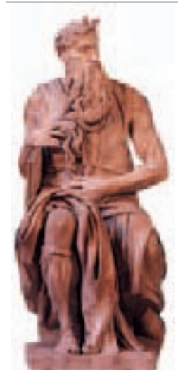
Le Moïse de Michel-Ange à Saint-Pierre-aux-Liens