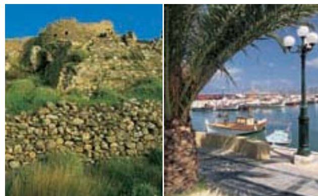
Gauche Forteresse de Palaióchora Droite Port de Siteia