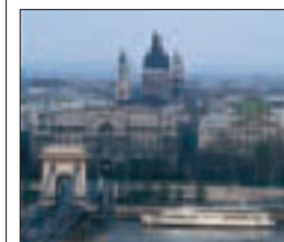
Basilique Saint-Étienne (p. 116-117) sur la rive est du Danube