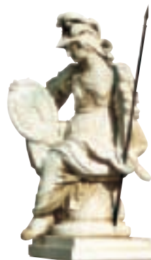
Athéna Pallas, ancien hôtel de ville