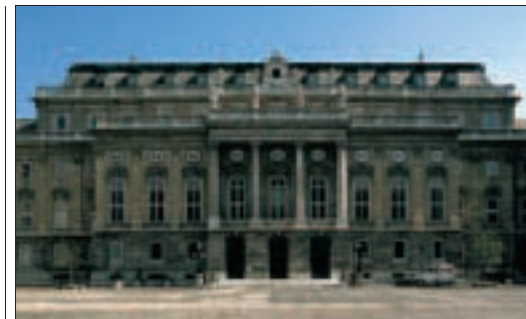
Galerie nationale hongroise (p. 74-77) dans l'ancien Palais royal