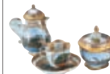
Service en porcelaine du musée des Arts décoratifs (p. 136-137)