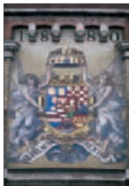
Armoiries hongroises ornant un mur près du Tunnel (p. 100)