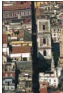
Le quartier de Spaccanapoli