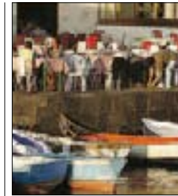
Terrasse, golfe de Naples