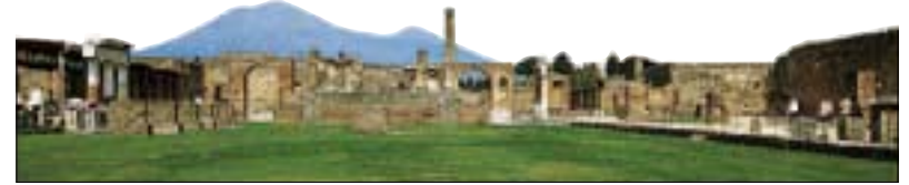
Vue panoramique du Forum de Pompéi, sur lequel veille le Vésuve