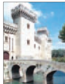
Le château de Tarascon

LA CÔTE D'AZUR ET LES ALPES-MARITIMES 60