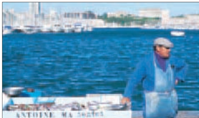
Pêcheur marseillais sur le Vieux-Port

Aussi soigneusement qu'il ait été établi, ce guide n'est pas à l'abri des changements de dernière heure. Faites-nous part de vos remarques, informez-nous de vos découvertes personnelles : nous accordons la plus grande attention au courrier de nos lecteurs.