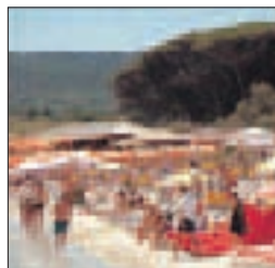
La plage de Pampelonne dans la presqu'île de Saint-Tropez