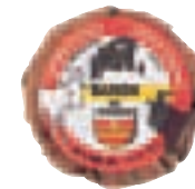
Fromage à l'Ancienne