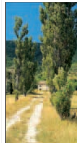
Exemple de paysages typiques entre Castellane et Grasse