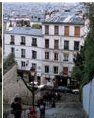
Gauche Bois de Boulogne Droite Montmartre