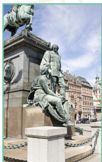
La City Pages 62-75