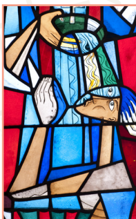
Gamla Stan Pages 46-61