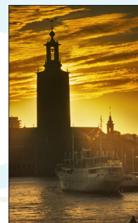
Les environs de Stockholm Pages 142-153