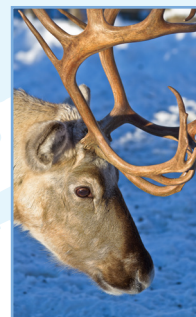
Djurgården Pages 86-101