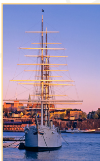
Blasieholmen et Skeppsholmen Pages 76-85

Dans ce guide, le centre de Stockholm a été divisé en quatre zones de couleurs différentes, dont les limites naturelles sont constituées par des voies d'eau ou, plus rarement, par une rue importante ; elles regroupent la plupart des sites essentiels. Les lieux intéressants situés hors du centre-ville sont décrits dans Malmarna et ses environs (p. 102-135). Le chapitre Les environs de Stockholm indique les endroits à visiter à l'extérieur de la métropole (p. 142-153).