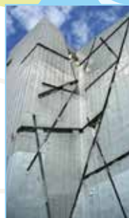
Kreuzberg Pages 140-149