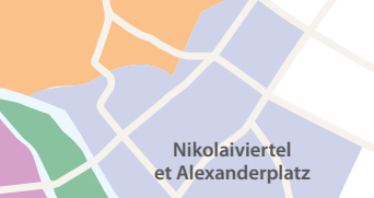
Nikolaiviertel et Alexanderplatz