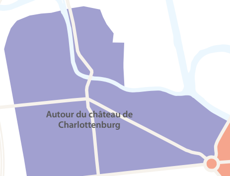
Autour du château de Charlottenburg