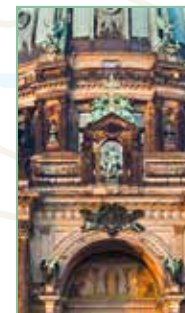
Museumsinsel Pages 72-87