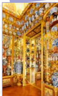
Autour du château de Charlottenburg Pages 160-169