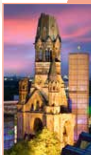
Autour du Kurfürstendamm Pages 150-159