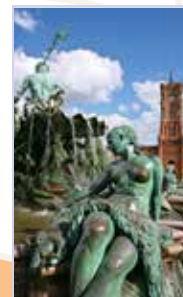
Nikolaiviertel et Alexanderplatz Pages 88-99