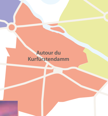
Autour du Kurfürstendamm