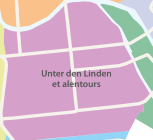
Unter den Linden et alentours