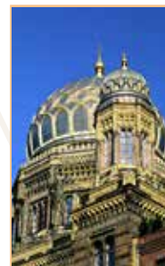
Du Scheunenviertel à la gare de Hamburg Pages 100-115