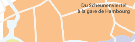
Du Scheunenviertel à la gare de Hamburg