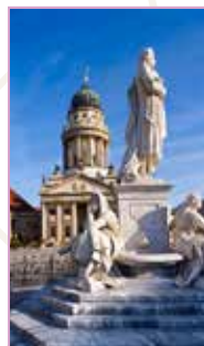
Unter den Linden et alentours Pages 56-71