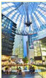
Tiergarten Pages 116-139