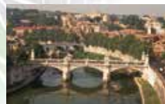
Ci-dessus Le Tevere