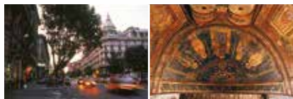
Gauche Via Veneto Droite Santa Maria in Cosmedin

Ce guide divise la vieille ville en huit quartiers, dont le plan ci-dessous montre la situation et l'étendue. Un chapitre est consacré aux environs de Rome. Chaque quartier est repéré par une couleur reprise tout au long du guide. Les principaux sites mentionnés dans cet ouvrage comportent une référence permettant de les repérer sur les deux plans généraux situés sur les rabats de couverture au début et à la fin du guide.