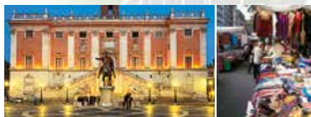
Gauche Piazza del Campidoglio Droite Marché de la via Salaria