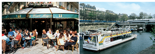
Gauche Les Deux Magots Droite Visite des canaux