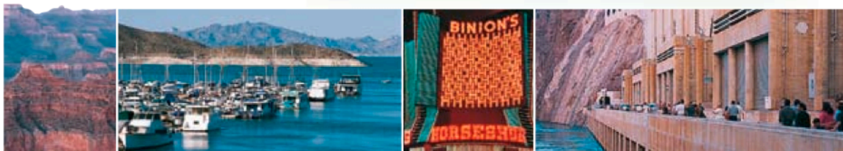
Gauche Grand Canyon Centre gauche Marina du lake Mead Centre droite Casino Binion's Horseshoe Droite Hoover Dam