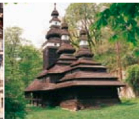
Gauche Façade du palais Golz-Kinsky Droite Église Saint-Michel, colline de Petřín